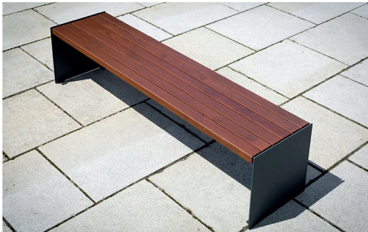
Cette image est illustrative et peut ne pas exactement reproduire le produit décrit.